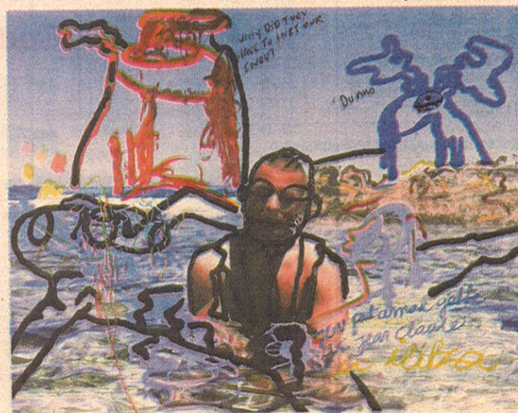
«UNTITLED», 2009. Oljemaleri på 240 ganger 300 centimeter.