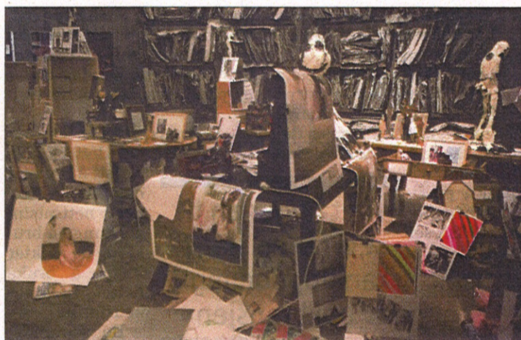
LEVD LIV: «Jealous» rommer også en av Melgaards store installasjoner, spesialprodusert for Astrup Fearnleys berømte Kiefer-rom.

av det eksplisitt seksuelle innholdet i kunsten hans. I arbeidet med de omstridte bildene som nå vises på Astrup Fearnley har Melgaard tatt for seg en periode i amerikansk samfunnsliv da den seksuelle frigjøringen sto sterkt, men hvor de etiske og moralske grensene heller ikke var gått opp. Fotografierne av de unge guttene er hentet fra blader utgitt av det pedofile nettverket Nambla, North-american Man/Boy Love Association.