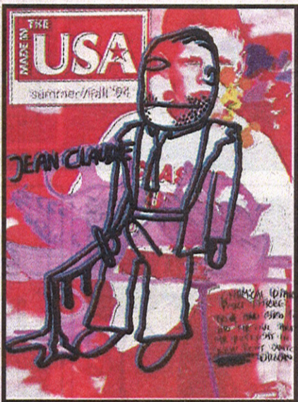
OMSTRIDT BLAD: Bjarne Melgaard avviser pedofilbeskyldninger, etter at han brukte bilder av unge gutter i det omstridte bladet «Made in the USA» som bakgrunn i noen av sine kjempemalerier. Her har han brukt forsiden.