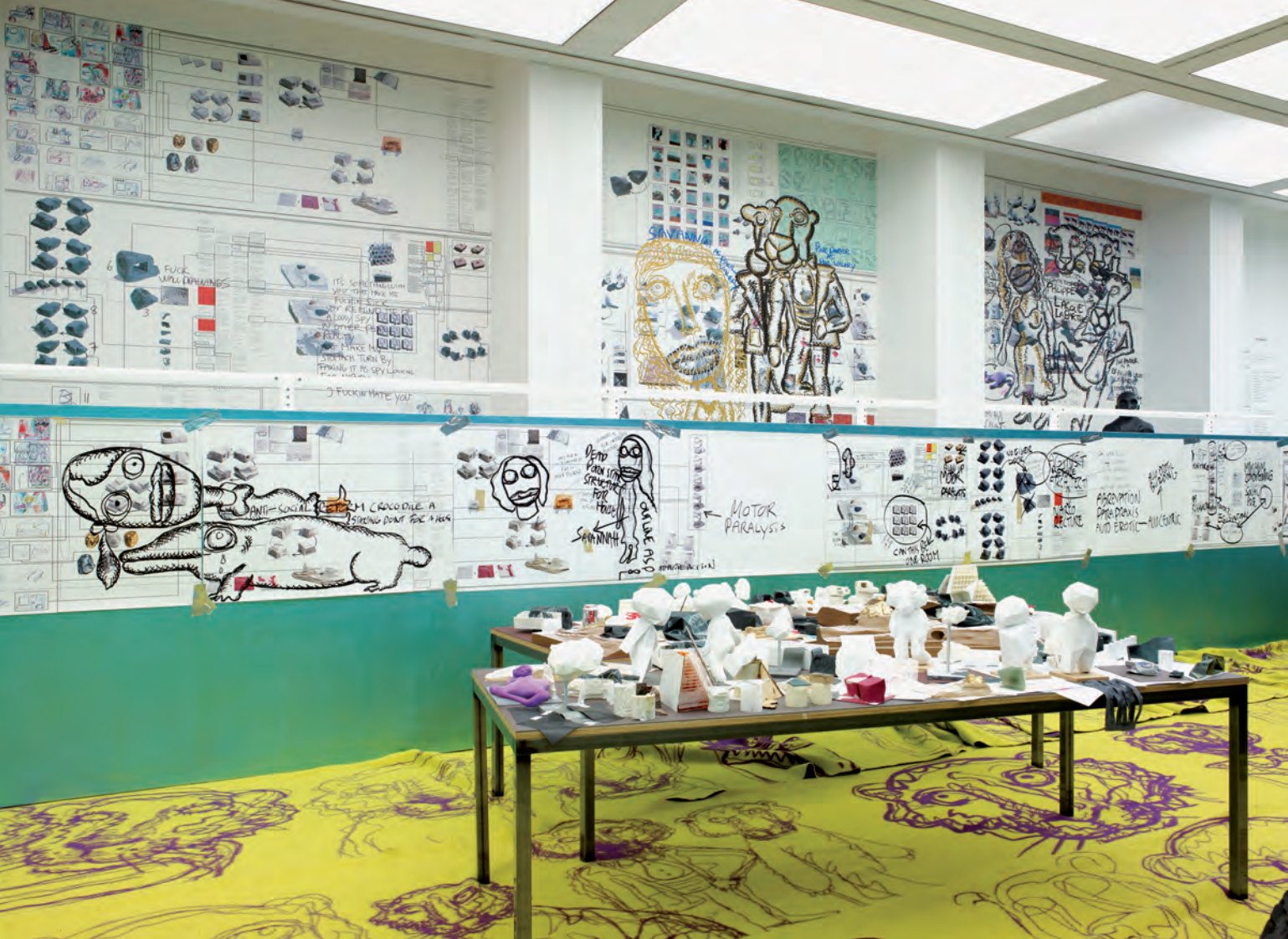
Installation views / Installationsansichten »A House to Die In«, ICA, London 2012