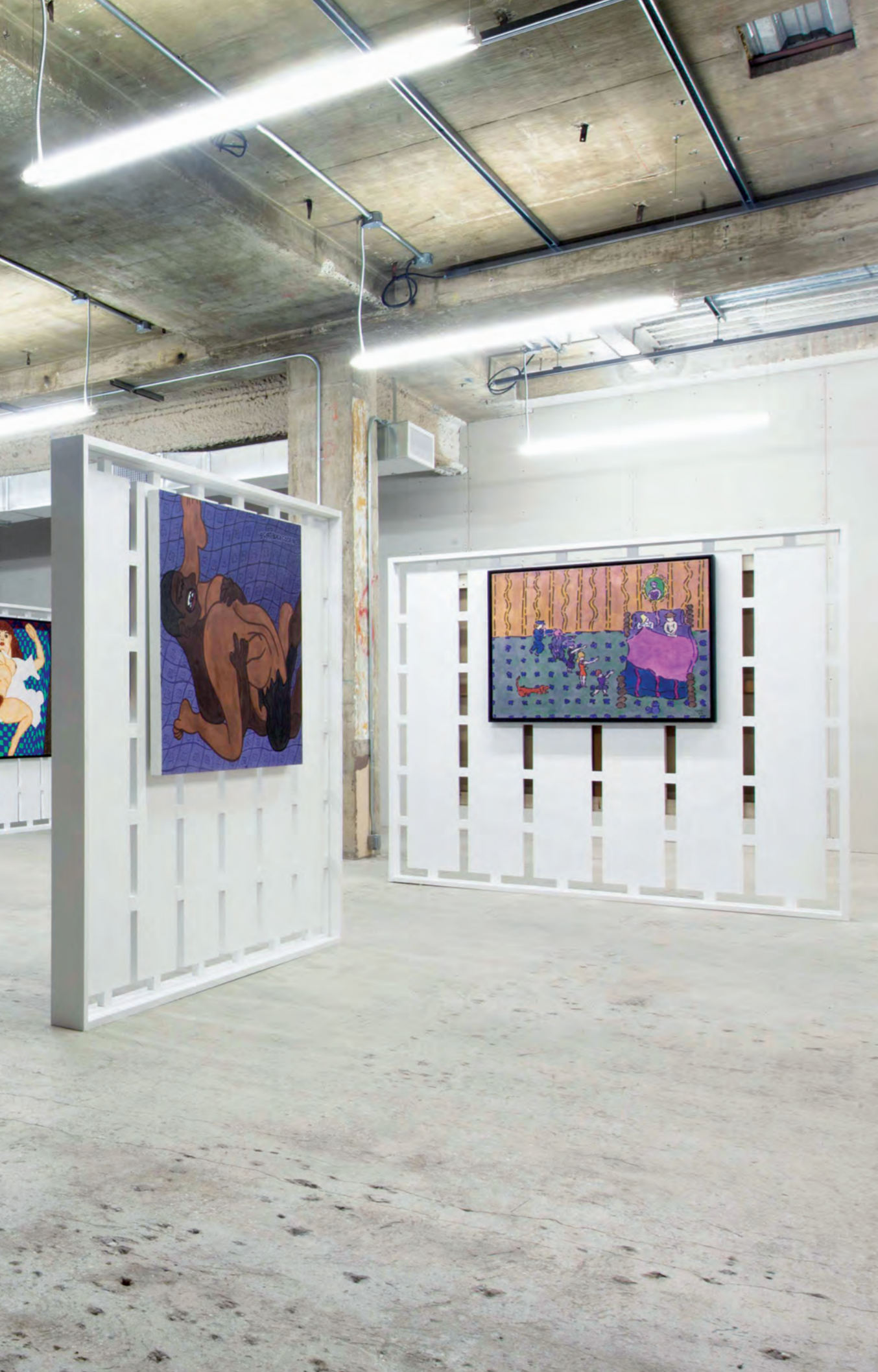
Installation view / Installationsansicht »Gang Bustr«, Venus Over Manhattan, New York 2013