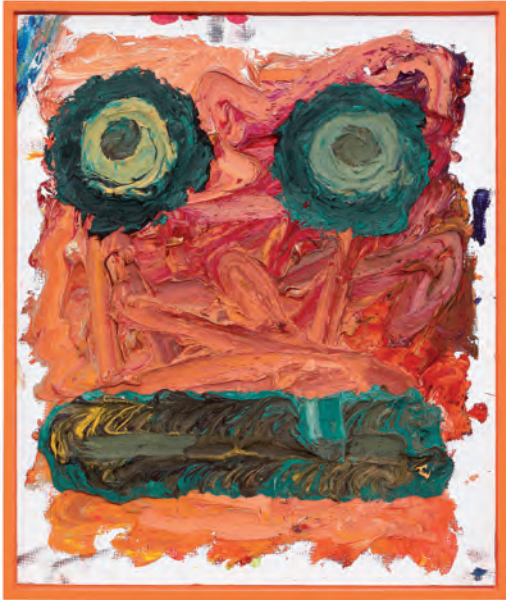
Untitled , 2013 Oil on canvas board / Öl auf mit Leinwand überzogene Platte 61 x 51 x 3 cm Courtesy Gavin Brown's enterprise, New York Photo: Thomas Müller