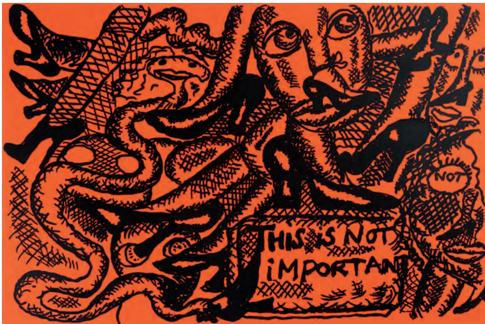
Untitled , 2013 Oil on canvas / Öl auf Leinwand 200 x 300 x 5 cm Courtesy Gavin Brown's enterprise, New York Photo: Thomas Müller