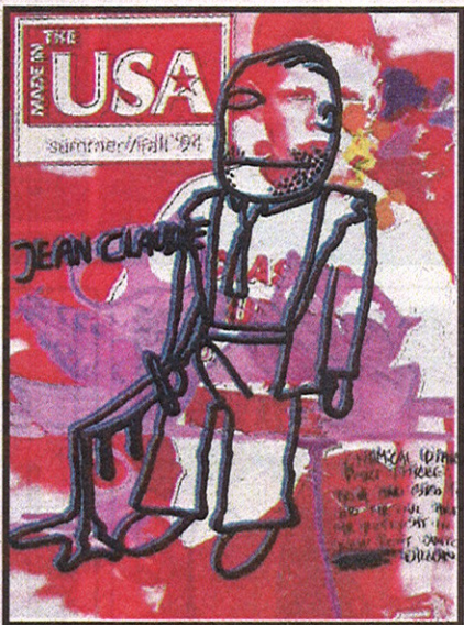
OMSTRIDT BLAD: Bjarne Melgaard avviser pedofilbeskyldninger, etter at han brukte bilder av unge gutter i det omstridte bladet «Made in the USA» som bakgrunn i noen av sine kjempemalerier. Her har han brukt forsiden.