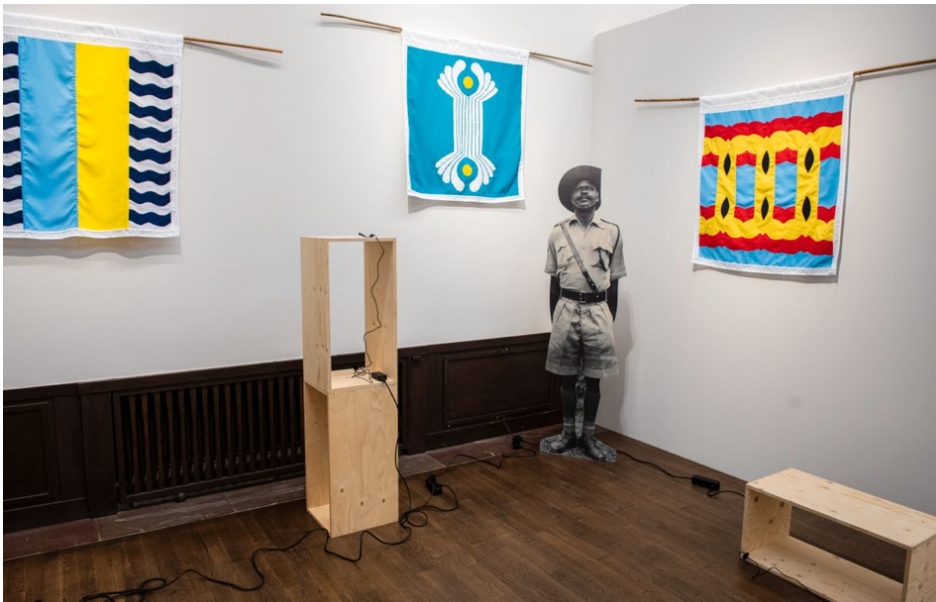
Samson Kambalu, "Nyasaland/Analysand", installationsvy, Galerie Nordenhake.

Så har också den 14:e upplagan av konstmässan blivit den kanske bästa någonsin. Just beroende på att de flesta gallerierna valt att göra separatutställningar, det vill säga att enbart visa verk av en konstnär, vilket medfört att den på mässor så vanliga plottrigheten inte är något problem här.