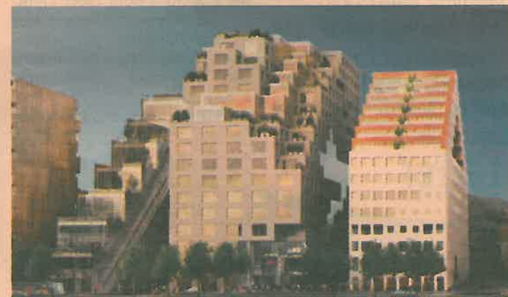
RUVENDE BYGG. DNBs nye tredelte hovedkvarter blir på omtrent 80.000 kvadratmeter.