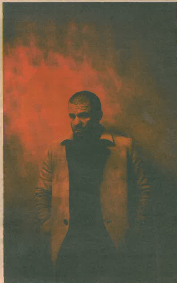
I VINDEN. Bjarne Melgaard er en av Norges mest omtalte og utstilte samtidskunstnere.