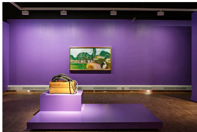
Melgaard+Munch: The End of It All Has Already Happened , installasjonsbilde, Munchmuseet 2015.