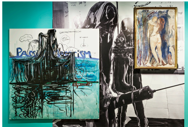
Melgaard+Munch: The End of It All Has Already Happened , installasjonsbilde, Munchmuseet 2015.