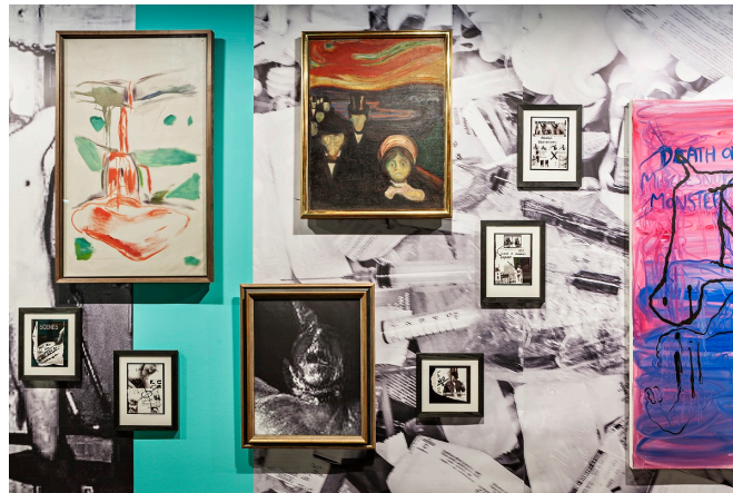
Melgaard+Munch: The End of It All Has Already Happened , installasjonsbilde, Munchmuseet 2015.

presentere Munchs bilder som pop-ups inne i Melgaardske scenografier. En versjon av Skrik er sågar gjemt bak et snuff-bilde av en mann som – passende nok – er i ferd med å dø av autoerotisk asfyksiasjon. Katalogdesignet til Snøhetta skrur til ikonoklasmen enda et hakk; i stedet for å gi en ryddig oversikt over verkene i utstillingen (noe som savnes) er det visuelle materialet klippet opp og mikset sammen til kaleidoskopiske mønstre. Med tanke på det markante utenforskapet som skildres i Munchs bilder, er det unektelig ironisk at han, når han skal aktualiseres, ender som auratisk bestanddel i et gesamtkunstverk med kollektiv avsender. Men for all del, Melgaard+Munch er en god Melgaard-Eriksen-Snøhetta-utstilling.