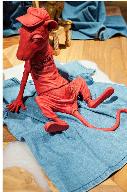
Melgaard+Munch: The End of It All Has Already Happened , installasjonsbilde, Munchmuseet 2015.

Det er åpenbart mye å hente i en sammenstilling av Munch og Melgaard, i hvert fall i teorien. I en utstillingssituasjon er det imidlertid en utfordring at de to kunstnerne opererer så ulikt. Kuratoren har løst dette ved å