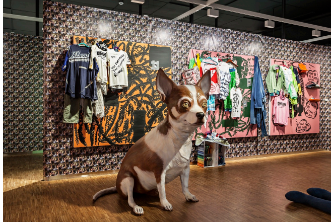
Melgaard+Munch: The End of It All Has Already Happened , installasjonsbilde, Munchmuseet 2015.