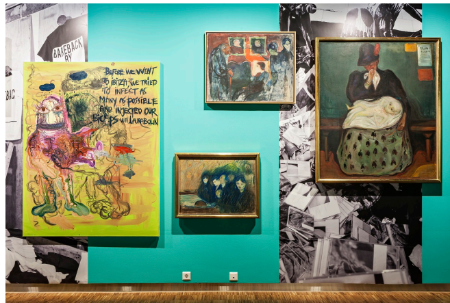
Melgaard+Munch: The End of It All Has Already Happened, installasjonsbilde, Munchmuseet 2015.

Man har ikke behøvd å grunne så hardt over hvem som skulle få sparke i gang den forestående serien med dialoger på Munchmuseet: Melgaard+Munch , de to navnene ved siden av hverandre klinger til og med catchy. I tillegg er koblingene mange og åpenbare: begge er norske kunstnere av internasjonalt format, begge assosieres med et ekspressivt (i Bjarne Melgaards fall også «utvidet») maleri, begge trekker på en betydelig personmytos og hos begge finnes det en uavklart selvbiografisk investering i kunsten. Det er med andre ord en utstilling som trygler så innstendig om å bli gjort at det nesten føles overflødig når noen faktisk går hen og gjør den. Men hvorfor det egentlig? En annen innvending mot den forterpede dialogutstillingen er jo at motivasjonen for sammenstillingen er uklar. Enda verre er det når faglig anemi kobles med sensasjonalisme, som Picasso vs. Duchamp på Moderna Museet i 2012, hvor utstillingen i desperat ånd ble markedsført som en boksekamp. Med undertittelen The End of It All Has Already Happened låner Munchmuseet i stedet drakraft fra ekspresjonismens aura av eksistensiell konkurrs. Heldigvis lodder utstillingen også dypere.