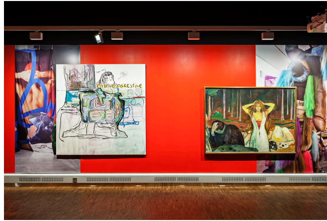
Melgaard+Munch: The End of It All Has Already Happened , installasjonsbilde, Munchmuseet 2015.