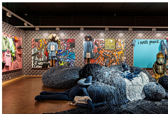
Melgaard+Munch: The End of It All Has Already Happened , installasjonsbilde, Munchmuseet 2015.