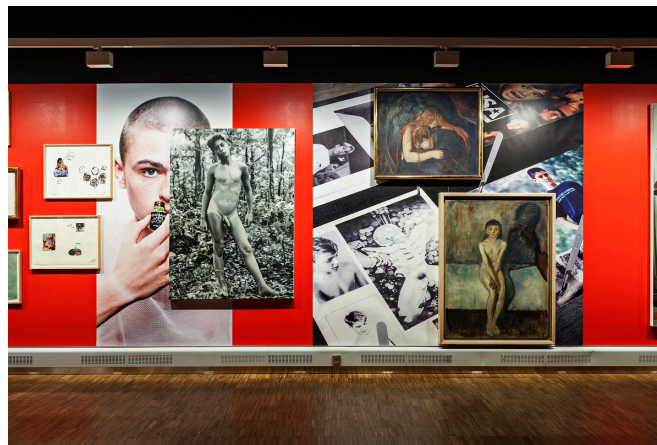
Melgaard+Munch: The End of It All Has Already Happened, installasjonsbilde, Munchmuseet 2015.

I Sex-avdelingen er lyset dempet. Kunsten henger om hverandre i store felt. Noen bilder er løftet ut fra veggen slik at de dels overlapper andre. Under ligger masete tapeter designet av Melgaard. Munch er presentert med forholdsvis mange malerier med sjalusi som tema. Et par kliner i bakgrunnen, i forgrunnen et blekt og dratt mannsansikt. Pubertet er hengt ved siden av et av Melgaards NAMBLA-malerier. Melgaards sex er mer eksplisitt og medietilfanget hans større; i en stop-motion-animasjon vist på en liten skjerm på veggen blir en mann som henger fra taket i en celle, omstendelig fistet. Det finnes ingen verksliste eller titler å orientere etter. Et feststemt soundtrack siver ut fra Daddypussy -rommet. Fornemmelsen av å befinne seg på Melgaards enemerker er påtagelig.