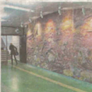
Svedmyra. Konstnär: Torgny Larsson. Verk: En fönstervägg av mosaik med naturmotiv.