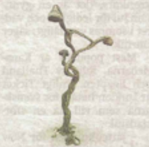
Stureby. Konstnär: Carin Ellberg. Verk: En 4–5 meter hög belysningsstolpe.