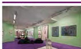
Melgaard og Bjertnes- to utstillinger